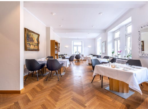
GOURMET-RESTAURANT 20 Personen