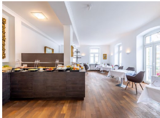
PARK-RESTAURANT 20 Personen